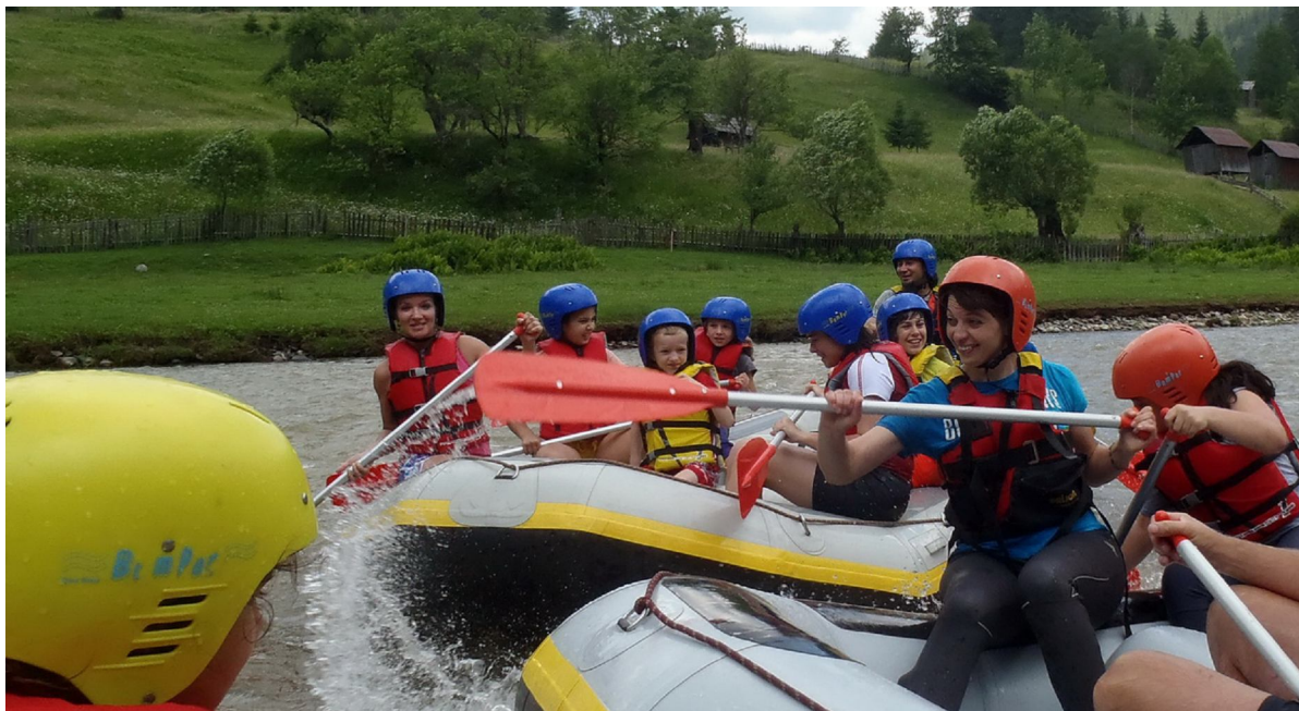
Fotografii: arhiva proprie Caliman Club; locatii: Raul Bistrita Aurie. Copyright: Caliman Club

Va rugam nu ezitati sa ne contactati daca aveti nevoie de orice fel de informatii suplimentare !